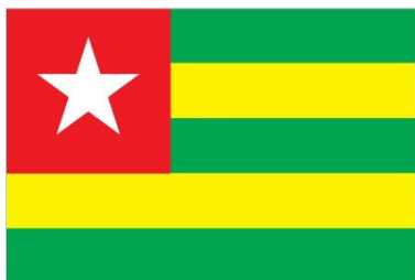
TOGOLESE REPUBLIC (AFRICA)